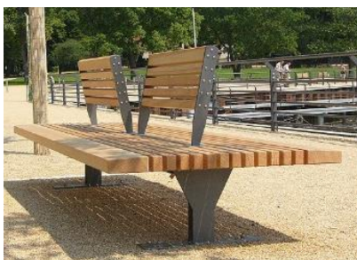
Bank „Kronach“ (Systembild)

Außerdem war es dem AK Ü60 ein Anliegen den Mühlbach ebenfalls Barrierefrei erlebbar zu machen. Mit dem „Platzerl am Mühlbach“, einer Pflasterfläche, die den Barrierefreien Blick auf den Mühlbach und das Verweilen an einem schattigen Ort ermöglicht, soll im Norden der Boule-Bahn ein weiterer Ort geschaffen werden der Alt und Jung zusammenbringen kann! Durch die spezielle Bank mit Klappbarer Lehne ist die Sitzrichtung frei wählbar um sich dem Geschehen am Festplatz oder am Mühlbach mit zu erleben.